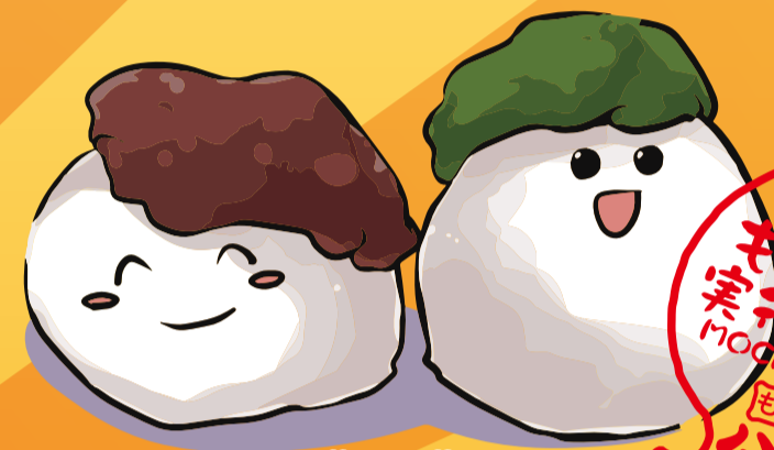
あんあん・ずんずん (制作 一関三高生)