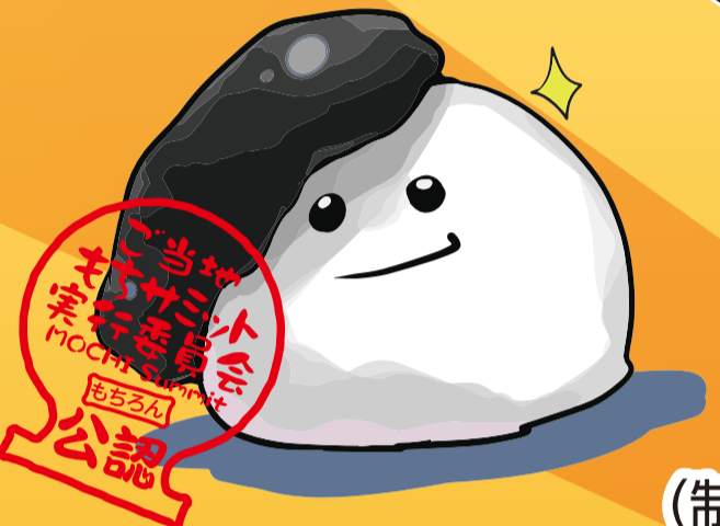
くろりん (制作 一関三高生)

2017.1.3[火]・4[水] 10:00~17:00 専門店街Fイーハートーブ広場